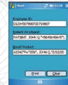
Etikettendruck auf mobilen Windows Geräten.